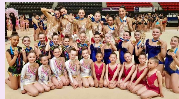
Ensemble 1 Trophée Régional 7-9 ans Ensemble 2 Trophée Régional 7-9 ans 4 ème et 7 ème du Championnat Régional de Bourgogne Franche-Comté 2024 à Besançon

Ensemble Trophée Fédéral B 17 ans et – Ensemble Trophée Fédéral B 13 ans et – Ensemble Trophée Fédéral C 13 ans et – Championnes Régionales Bourgogne Franche-Comté 2024 Qualifiées au Championnat de France 2024 à Pont de Cé